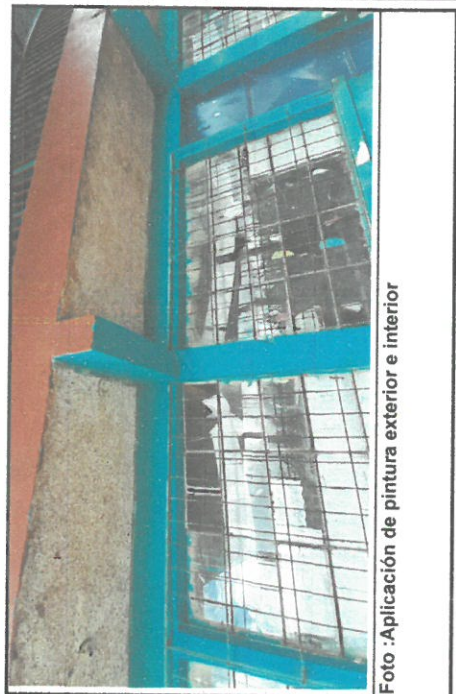
Foto .Aplicacion de pintura exterior e interior

Observación: Si es necesario se pueden agregar hojas adicionales y actualizar el número de hojas.